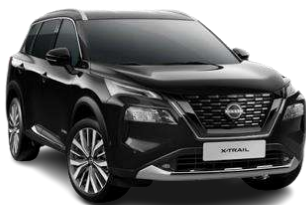
Чорний перламутр - G41