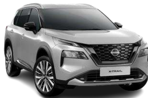
Сріблястий - K23