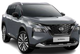
Сірий перламутр - KBV