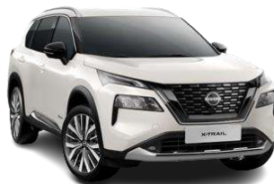
Білий перламутр - QAB