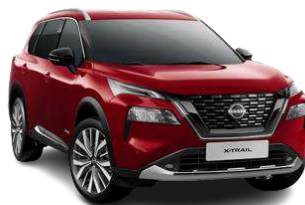
Червоний перламутр - NBL