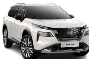
Білий перламутр - QBE