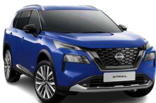
Синій - RBV