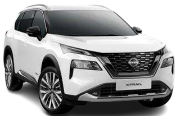
Білий - QAK