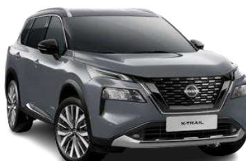
Сірий перламутр - KBV