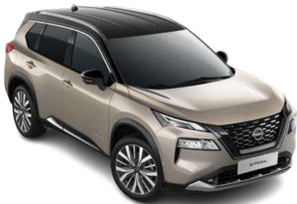
Срібло шампань з чорним дахом – XEW

Двоколірний кузов (основний колір – металік) – 26 400 грн