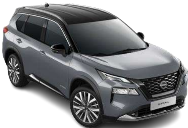
Сірий перламутр з чорним дахом – XEX

Двоколірний кузов (основний колір – преміум/перламутр) – 34 760 грн