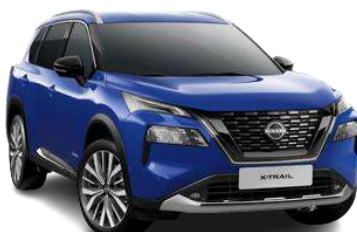
Синій - RBV