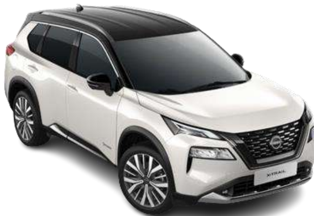
Білий перламутр з чорним дахом – XKJ