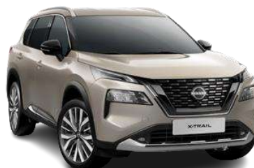
Срібло шампань - KAY