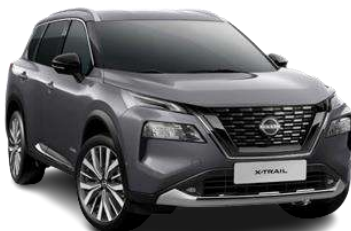
Темно-сірий - KAD