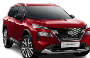
Червоний перламутр - NBL