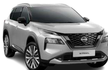
Сріблястий - K23