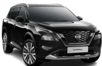
Чорний перламутр - G41