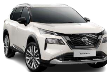
Білий перламутр - QBE