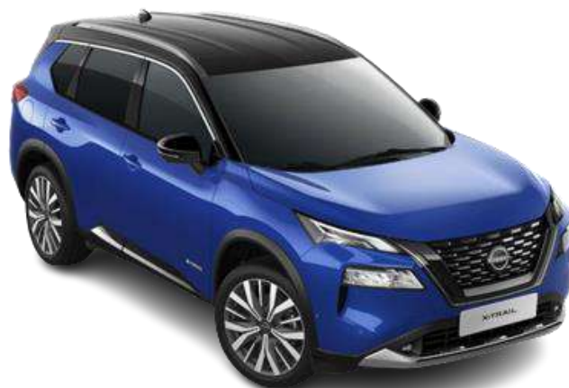
Синій металік з чорним дахом – XEU

Двоколірний кузов (основний колір – преміум/перламутр) – 34 760 грн