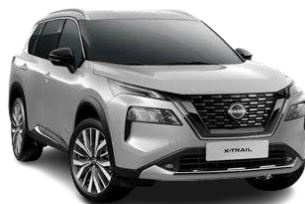
Сріблястий - K23