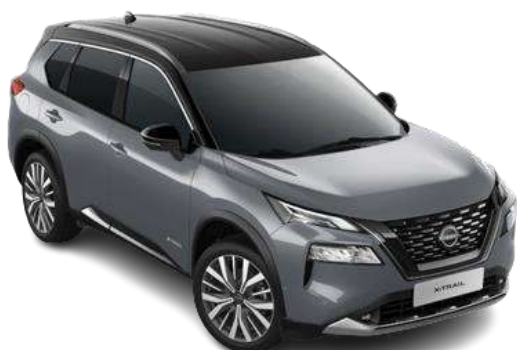
Сірий перламутр з чорним дахом - XEX

Двоколірний кузов (основний колір - преміум/перламутр) – 57 790 грн