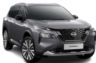
Темно-сірий - KAD