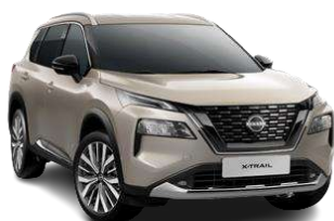
Срібло шампань - KAY