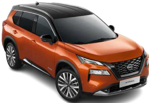
Помаранчевий металік з чорним дахом - XEV

Двоколірний кузов (основний колір – металік) – 48 330 грн