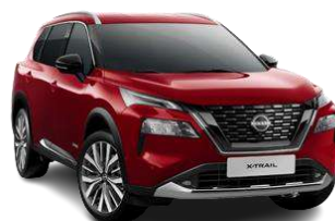
Червоний перламутр - NBL