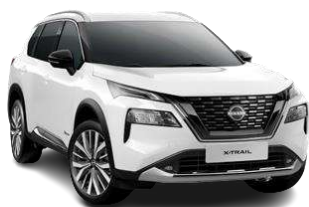
Білий - QAK