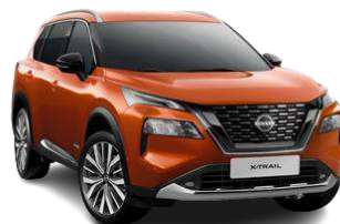
Помаранчевий - EBL