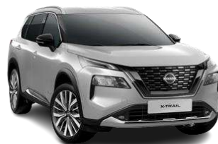
Сріблястий - K23