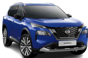
Синій - RBV