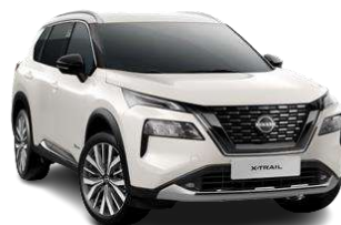
Білий перламутр - QAB