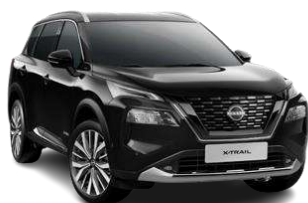
Чорний перламутр - G41