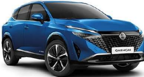
Лазурний перламутр – RCF