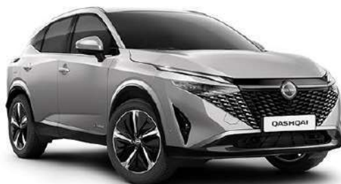
Сріблястий – KYO