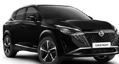
Чорний перламутр – GAT