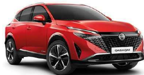
Червоний Fuji Sunset – NBV