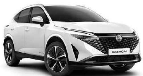
Перлинно-білий – QBE