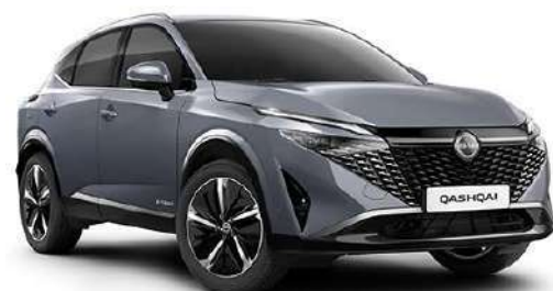
Сірий перламутр – KBY