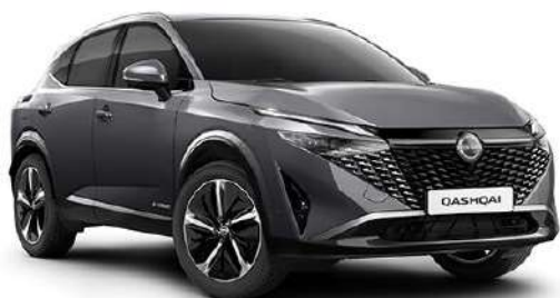
Темно-сірий – KAD