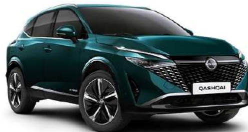
Синьо-зелений преміум – FAP