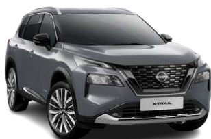
Сірий перламутр - KBY