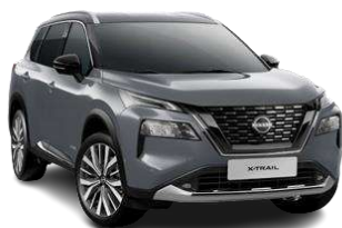
Сірий перламутр - KBY