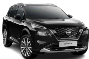
Чорний перламутр - G41