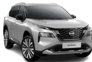
Сріблястий - K23