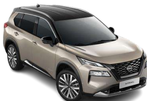
Срібло шампань з чорним дахом - XEW