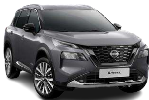
Темно-сірий - KAD