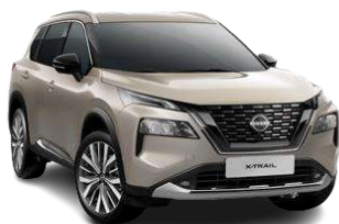
Срібло шампань - KAY