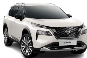
Білий перламутр - QAB