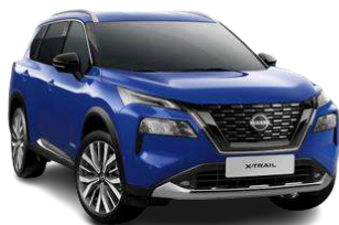
Синій - RBV